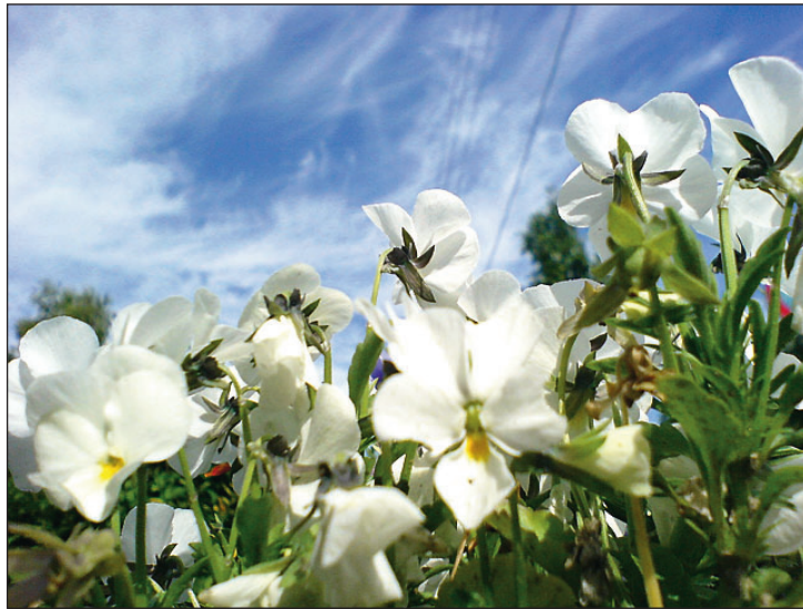
Blomsterbed tatt fra en annen vinkel med skyer i bakgrunnen.