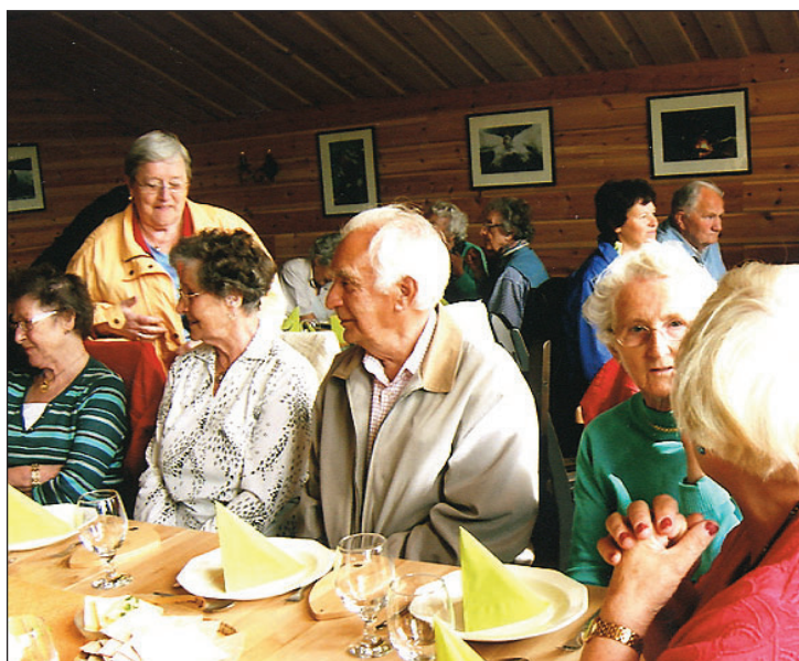
SERVERING: I det nyåpnede serveringshuset ble det servert mat av ypperste klasse fra Sæterstad gårds egen produksjon.

med kaffestopp i Viltkøtan. Deretter bar det ned til Hattfjelldal og hotellet hvor vi spiste middag. Etter dette var vi på hjemtur, fornøyde på opplevelser, mat og at været var så bra. En sosial og fin opplevelse. Takk for en hyggelig