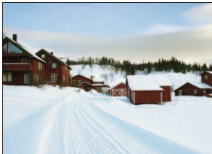
UTVIKLING: Sæterstad gård har vært i kontinuerlig utvikling i snart 30 år.

Av Asbjørg Sande asbjorg.sande@helgeland-arbeiderblad.no