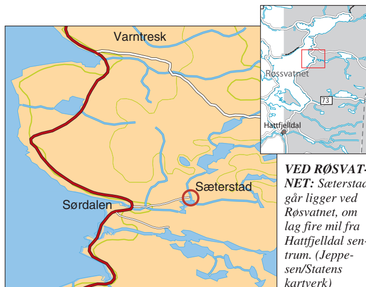
VED RØSVATNET: Sæterstad gård ligger ved Røsvatnet, om lag fire mil fra Hattfjelldal sentrum.